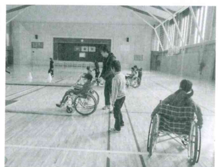
12月2日(水)古川小学校5年生