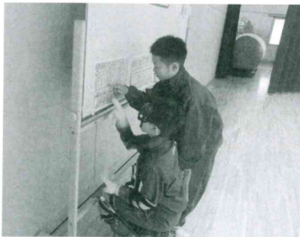
12月17日(木)神岡小学校5年生