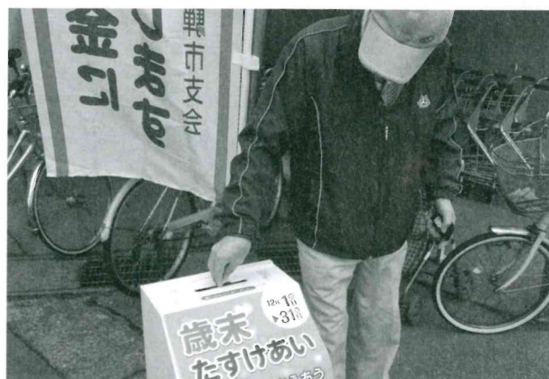
民生委員協力による歳末たすけあい街頭募金

また、歳末たすけあい募金につきましては、平成26年度配分繰越額と併せて昨年12月末に配分を受け、飛騨市社会福祉協議会の歳末地域福祉事業や激励金交付を行いました。温かいご協力を誠にありがとうございました。