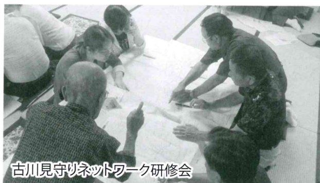
古川見守りネットワーク研修会