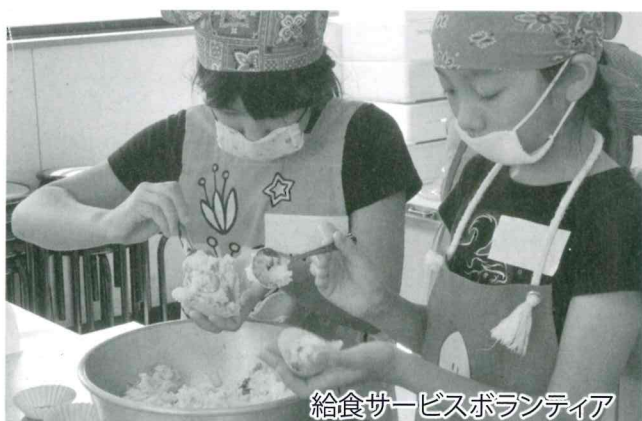
給食サービスボランティア