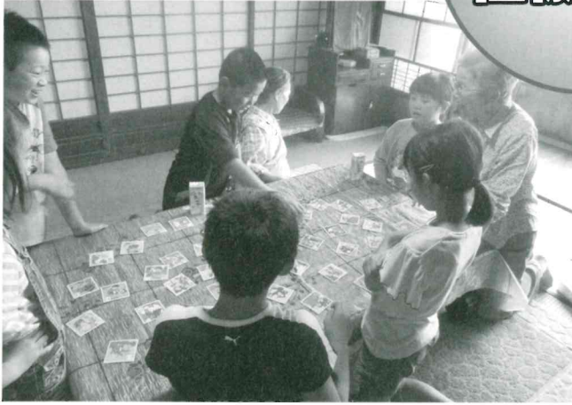
神岡地区近隣見守りネットワークブロック別研修会