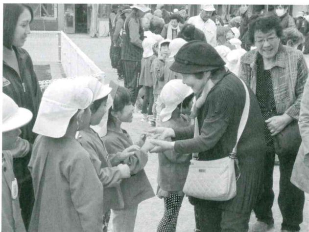
ひとり暮らし高齢者交流事業(ふれあい交流会)