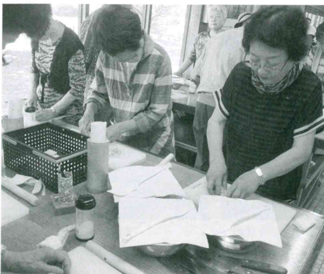
ひとり暮らし高齢者交流事業