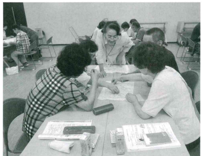
神岡地区近隣見守りネットワークブロック別研修会