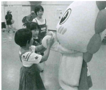
福祉・ボランティアフェスティバル