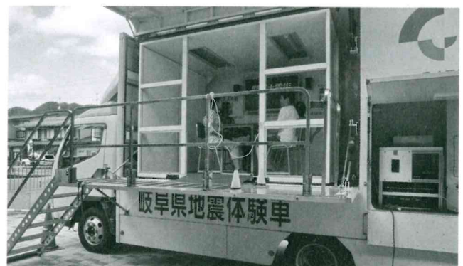
地震体験車出前講座