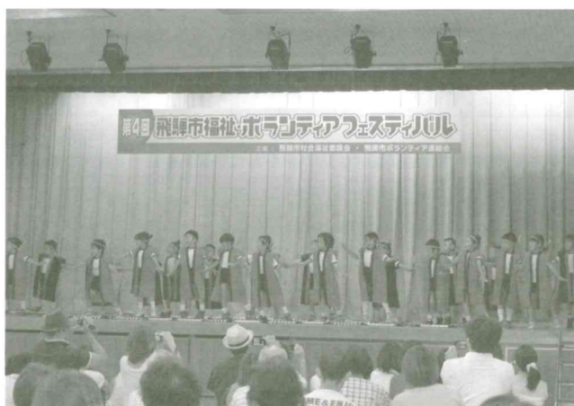
飛騨市福祉・ボランティアフェスティバル