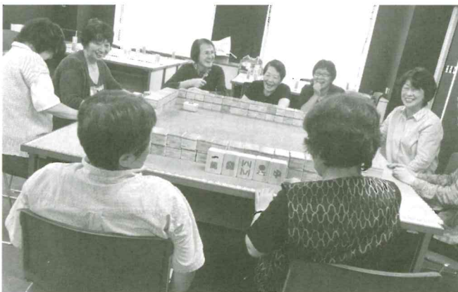
コミュニケーションマージャン講座