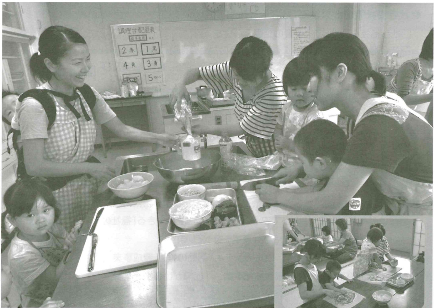
「カフェワゴン」親子でピザ作り