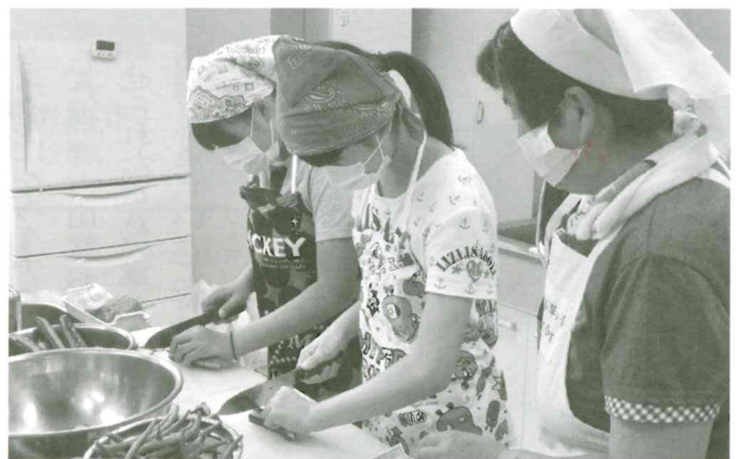
給食サービスボランティア