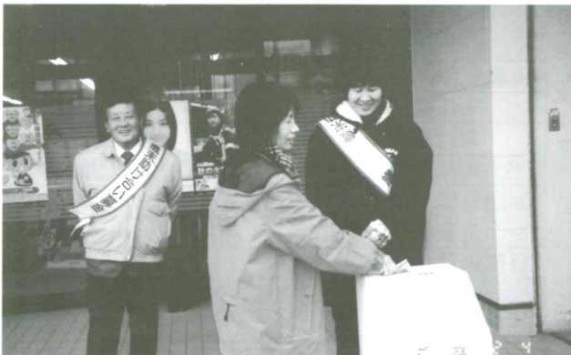
歳末助け合い運動