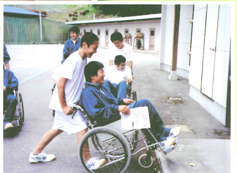
吉城高校福祉体験学習

■発行／飛騨市社会福祉協議会 〒509-4221 飛騨市古川町若宮二丁目1番66号 古川町総合会館内 TEL (0577) 73-3214 ■印刷／有限会社村坂印刷 〒509-4245 飛騨市古川町幸栄町7-30 TEL (0577) 73-3330