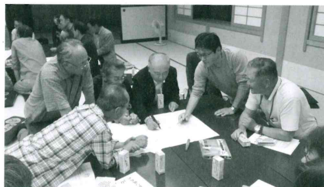
古川見守りネットワーク事業