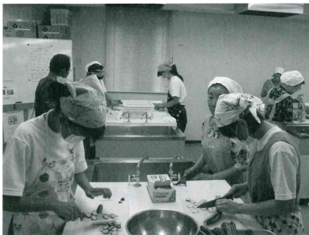
神岡中学校給食サービス ボランティア