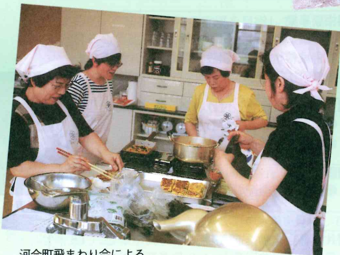
河合町飛まわり会による 給食サービス