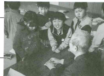
点字に関する学習会