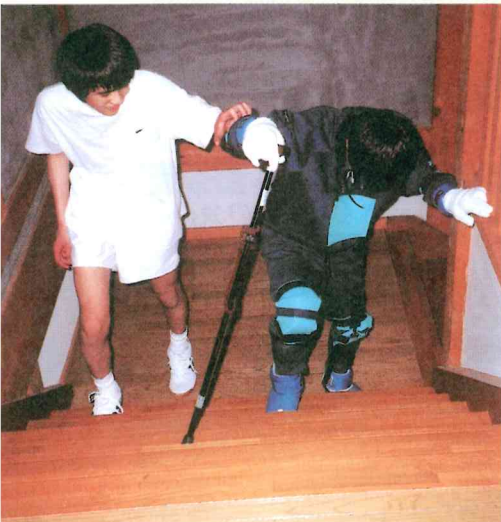
吉城高校福祉体験