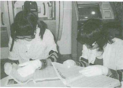
ワークキャンプ 疑似体験