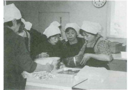
なずな会による給食サービス