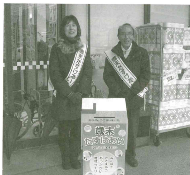
パロー神岡店前街頭募金

また、「歳末たすけあい募金」につきましては、歳末に行う事業や激励金の交付に配分を受けました。温かいご協力を誠にありがとうございました。