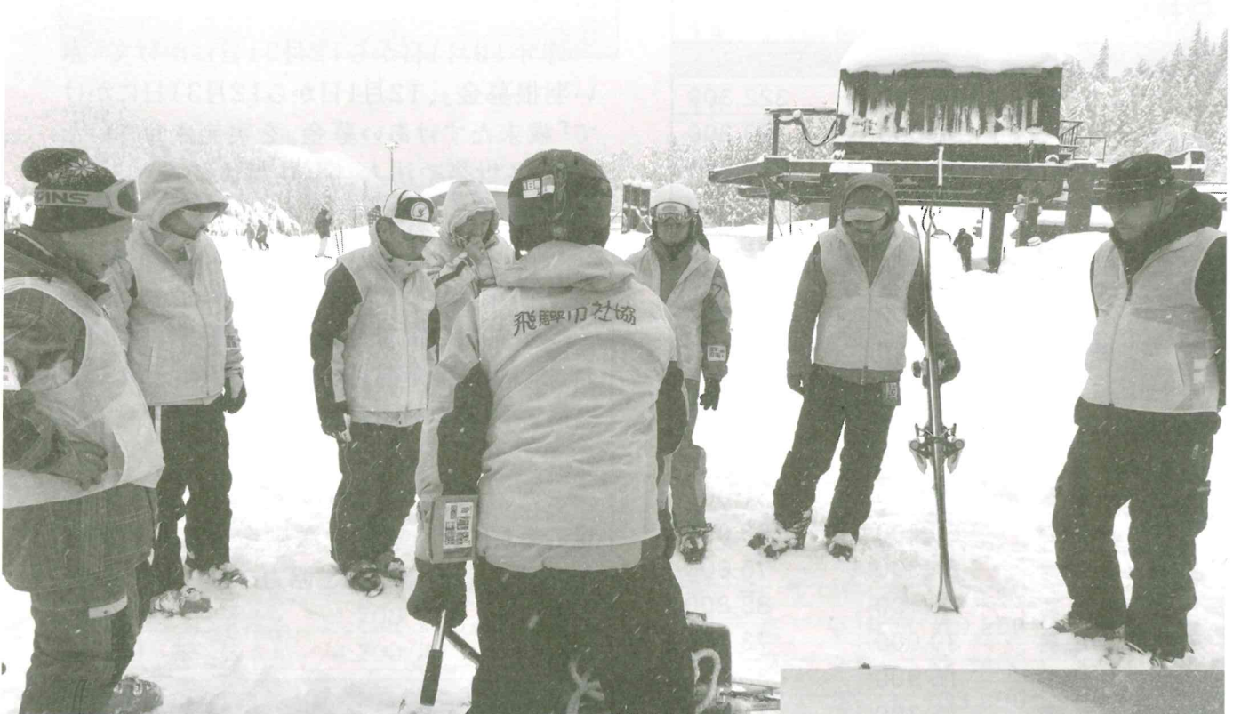
1月17日(土)に開催したチェアスキーボランティア講座の様子 (関連ページ 10 ページ)