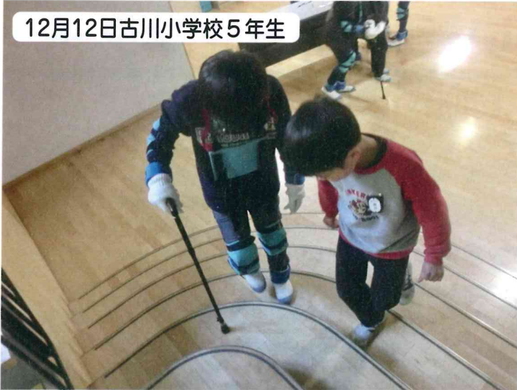
12月12日古川小学校5年生