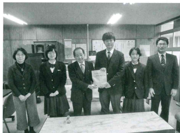
飛騨神岡高校美術部の皆さんから募金をいただきました

また、歳末たすけあい募金につきましては、昨年12月末に配分を受け、激励金の配布やイクメンクッキング等の事業を実施させていただきました。温かいご協力を誠にありがとうございました。