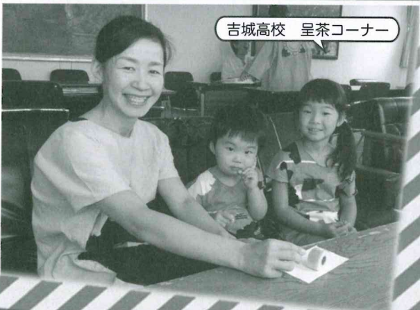
吉城高校 呈茶コーナー