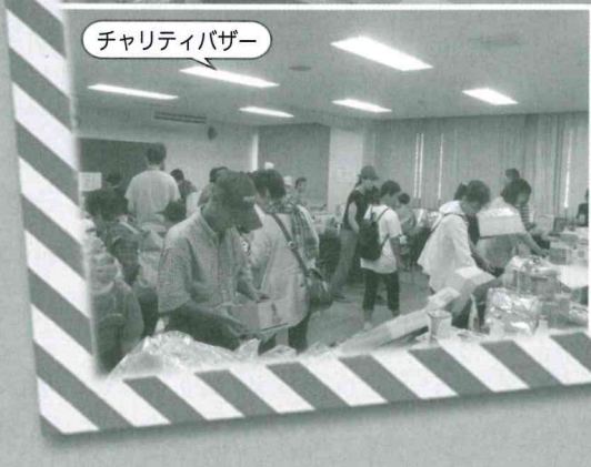
チャリティバザー