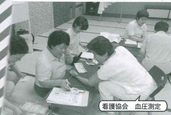
看護協会 血圧測定