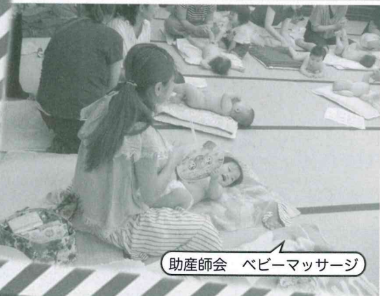
助産師会 ベビーマッサージ