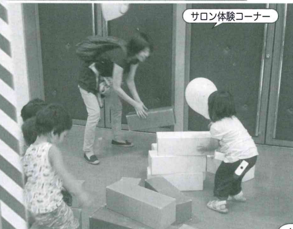
サロン体験コーナー