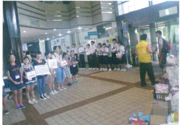
8月26日第7回飛騨市福祉・ボランティアフェスティバルでの募金活動の様子

皆さまから寄せられた募金は、岐阜県共同募金会へ全額送金し、平成30年度に県内の福祉事業に配分され、飛騨市では給食サービスや高齢者の見守り活動などに使われます。皆さまの温かいご協力をお願いいたします。