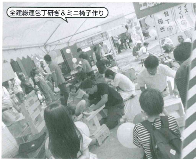
全建総連包丁研ぎ&ミニ椅子作り