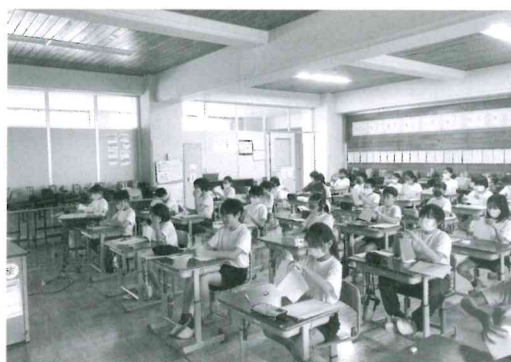
神岡小学校出前講座