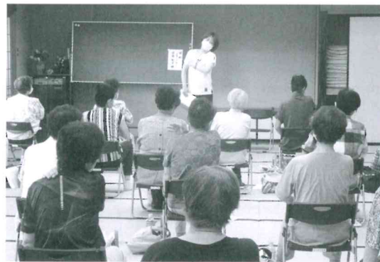
ふれあいサロン交流会