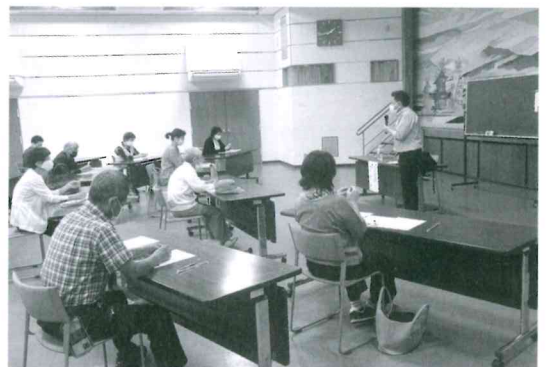
ボランティア講演会