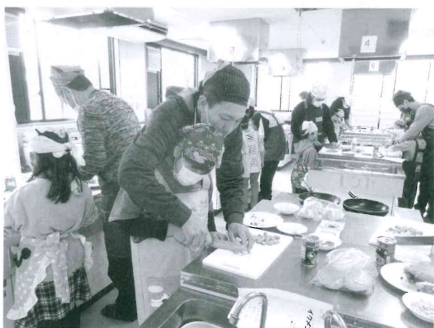
イクメンクッキング