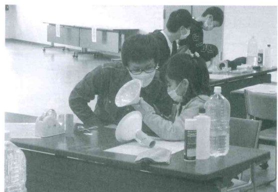
イクメン支援講座