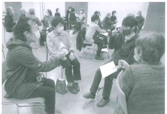
支えあいヘルパー・あんきねっと支援会員フォローアップ研修