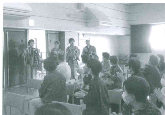
ふれあいサロン交流会