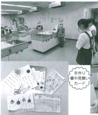
手作り 暑中見舞い カード

令和5年7月28日に飛騨神岡高等学校生徒の方々に、神岡給食サービスボランティア体験にご参加いただきました。