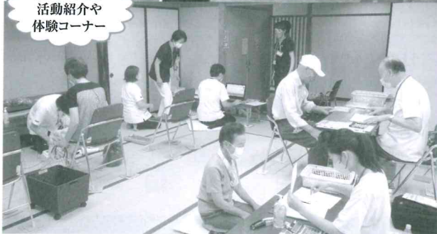
各団体による 活動紹介や 体験コーナー