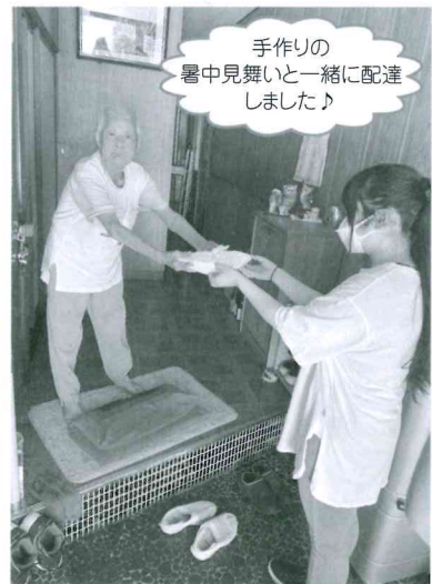
手作りの 暑中見舞いと一緒に配達 しました♪