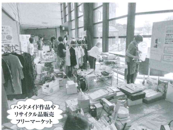
ハンドメイド作品や リサイクル品販売 フリーマーケット