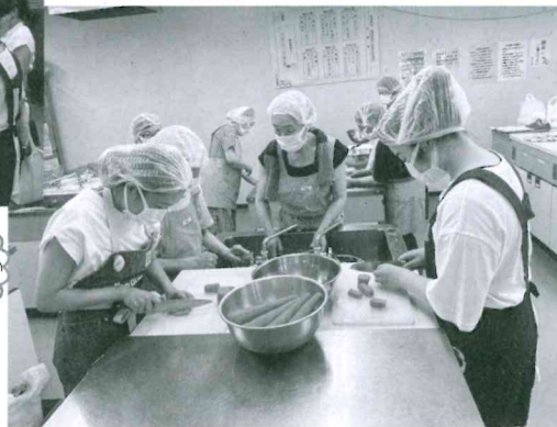
調理ボランティア なすな会の方々と一緒に配食弁当作り