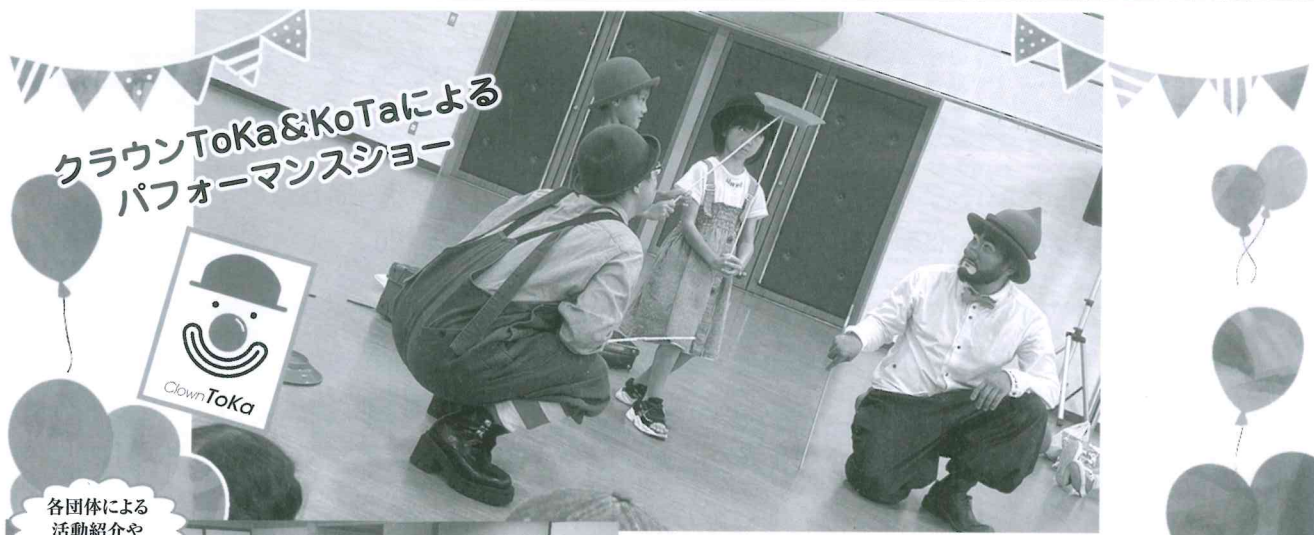
クラウンToKa&KoTaによる パフォーマンスショー