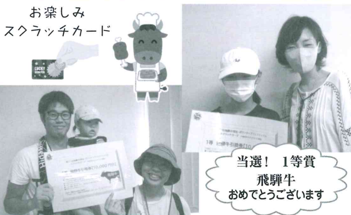
お楽しみ スクラッチカード