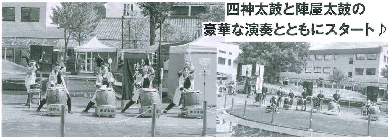
四神太鼓と陣屋太鼓の 豪華な演奏とともにスタート♪

今年の反省点等を活かして今後も皆様に楽しんでいただけるイベントになるように努力をして参ります。ご来場いただいた皆様、また、ご協力いただいた皆様、本当にありがとうございました。